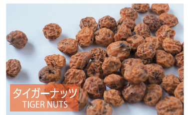
タイガーナッツ TIGER NUTS