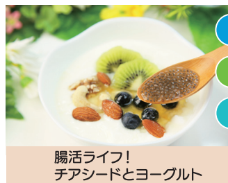
腸活ライフ! チアシードとヨーグルト